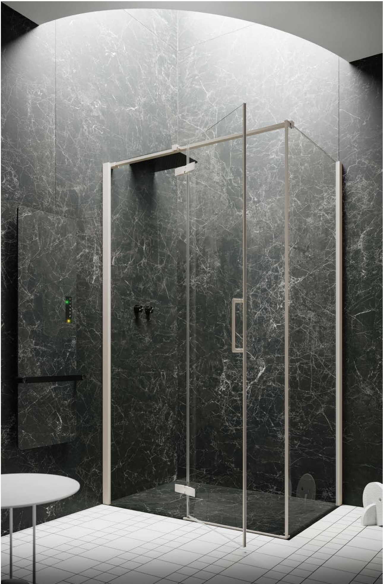
Battente Hinged door