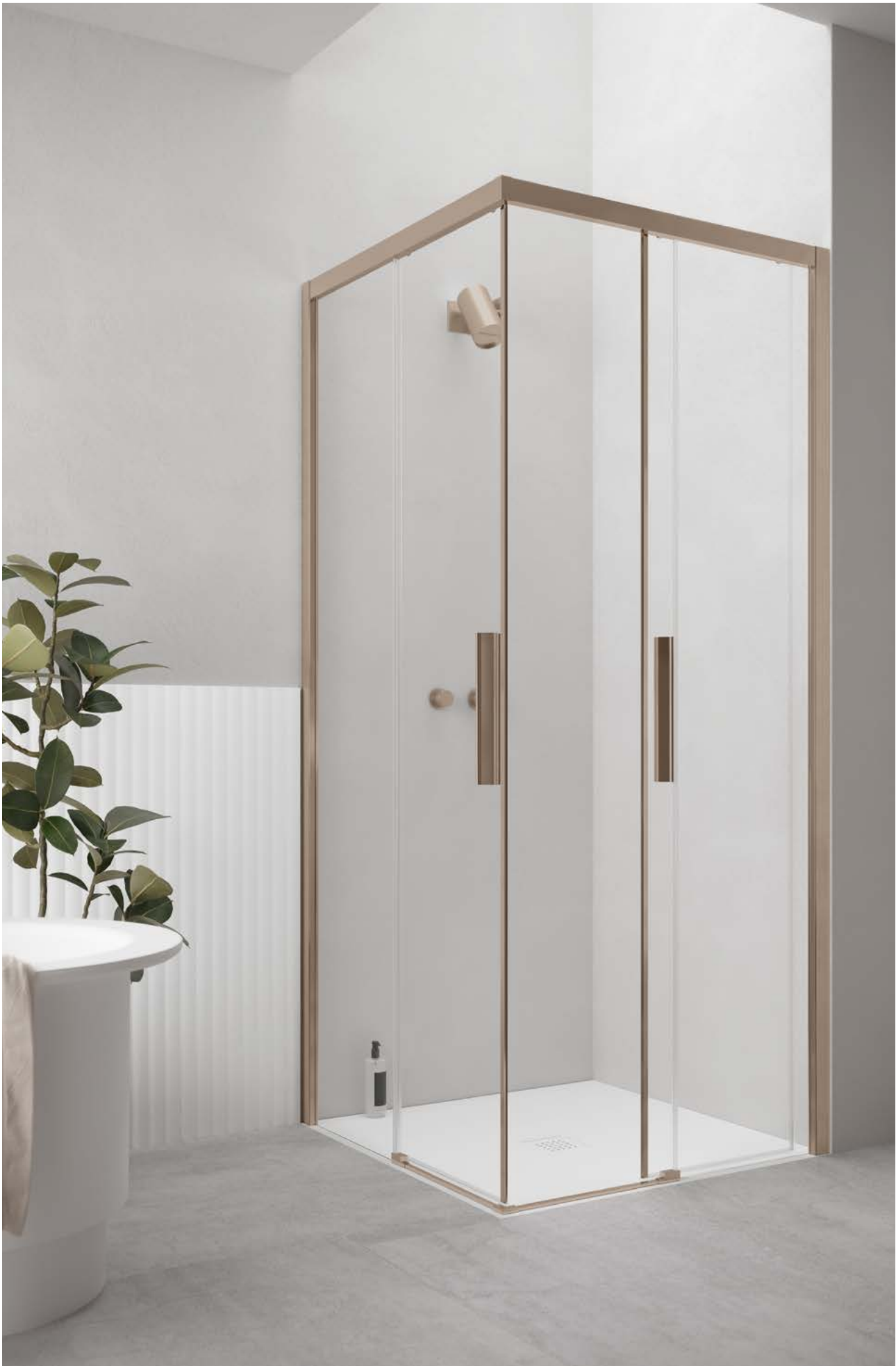
Scorrevole Sliding door