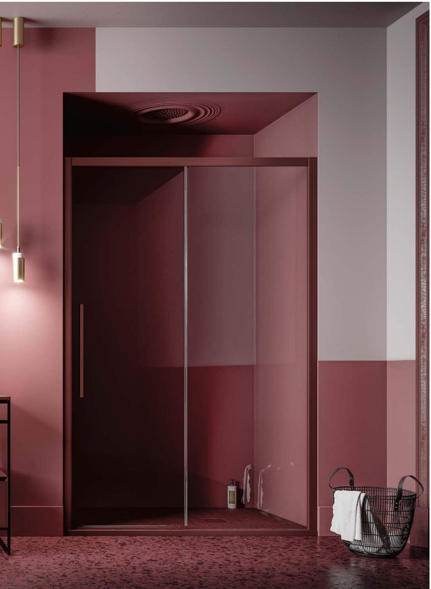
Scorrevole Sliding door