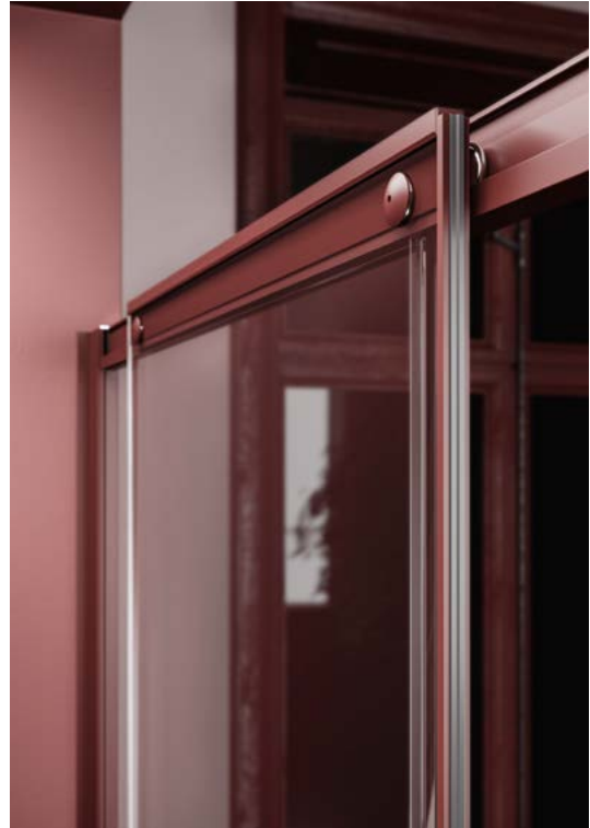
Scorrevole Sliding door

La barre transversale vue de l'intérieur de la cabine de douche: elle est conçue pour présenter des lignes élégantes et pour permettre un nettoyage facile.